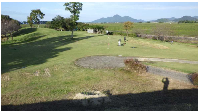
グラウンドゴルフ場