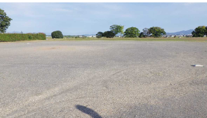
運動場(グラウンド)