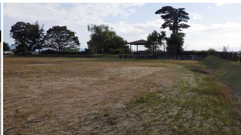
運動場(グラウンド)