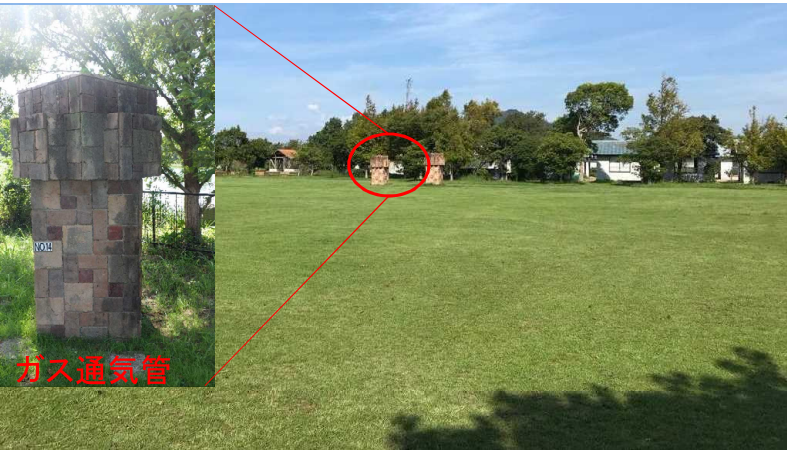
芝生広場(共有スペース)