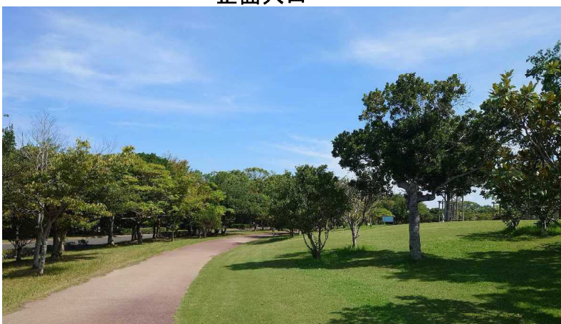
ウォーキングコース