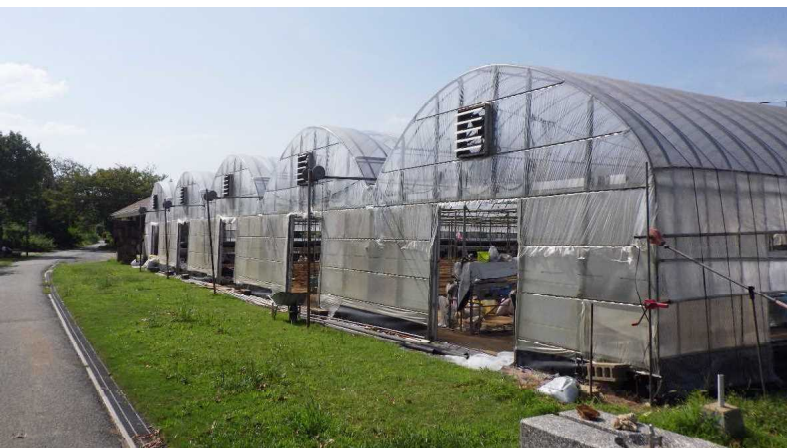
ふれあい農園(体験農園)