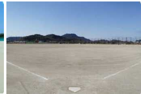
多目的グラウンド