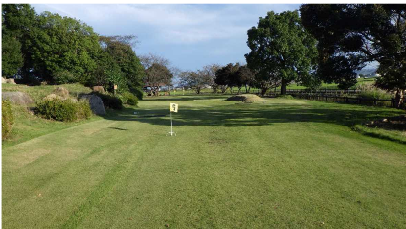
グラウンドゴルフ場