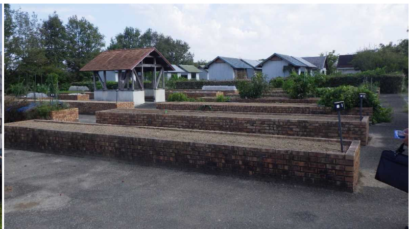
棚式農園(貸し農園)