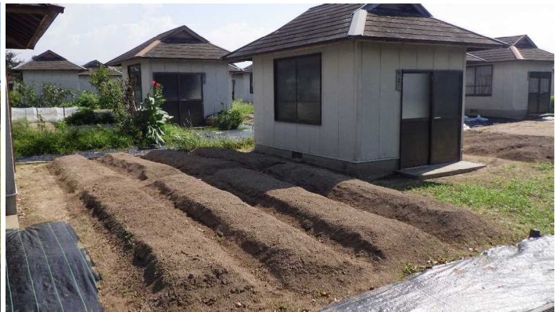
休憩ハウス付き農園(貸し農園)