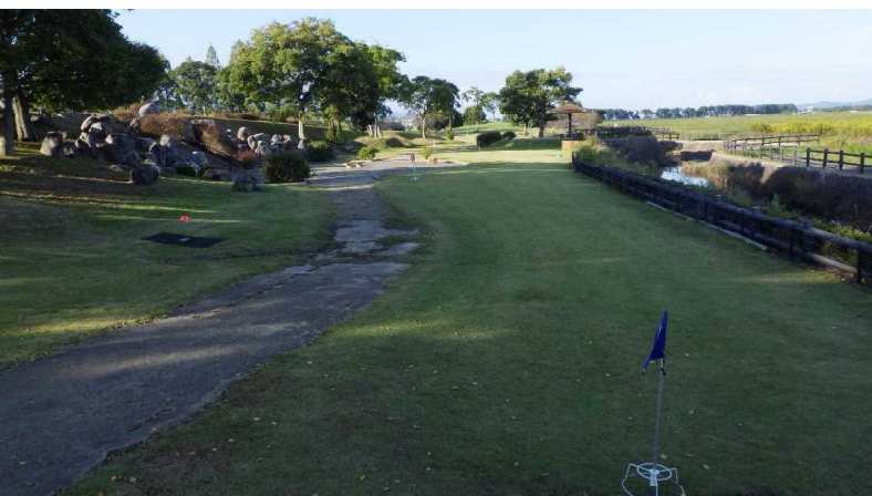
グラウンドゴルフ場