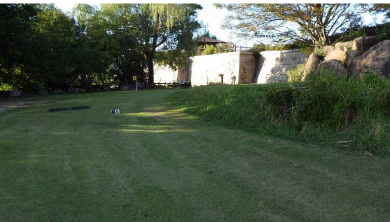
グラウンドゴルフ場