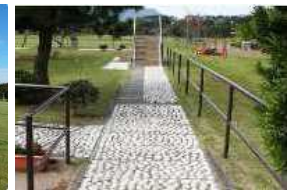
リフレッシュロード