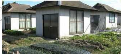
休憩ハウス付き農園