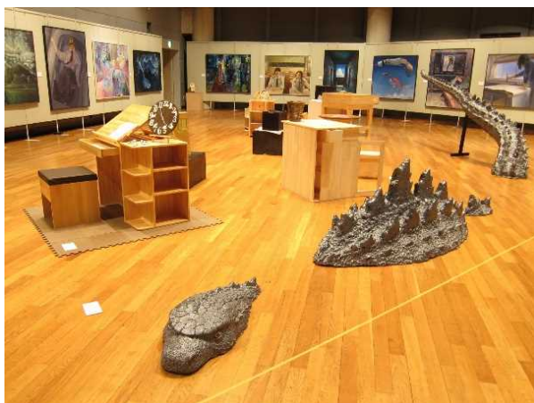
第24期生卒業制作展の様子

○その他：ご観覧に際しては、感染症対策として、マスクの着用と受付での手指の消毒をお願いいたします。また混雑時には入場を制限する場合がありますので、ご了承ください。