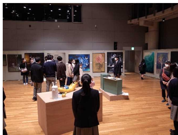
第25期生卒業制作展の様子

※取材に関するお問い合わせは、上記担当者までお電話いただきますようお願いいたします。