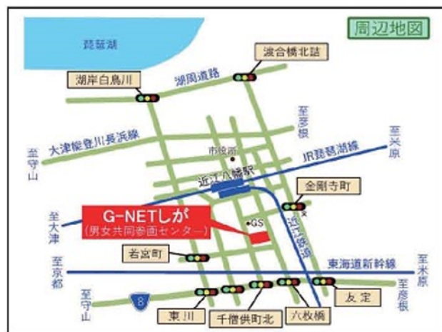
滋賀県立男女共同参画センター(G-NETしが)

RYT200 (ヨガインストラクター講座 200時間) 修了 RPYT85 (マタニティ・産後ヨガ講座 85時間) 修了 理学療法士