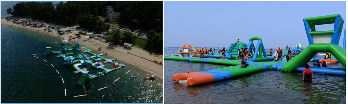
アドベンチャーウォーターパーク