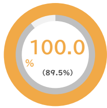
育休から復帰した女性の割合