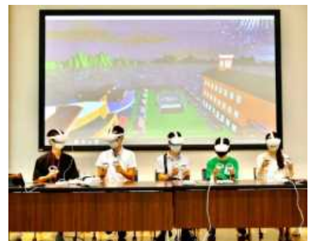
立命館守山高校での実施体験の様子