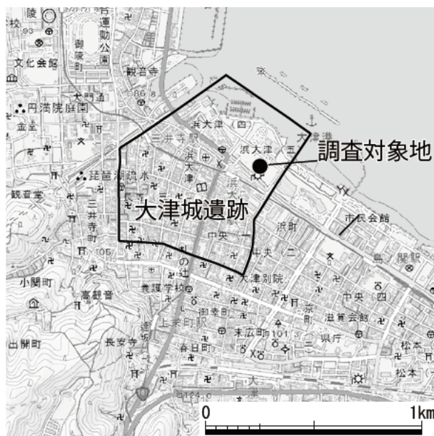
第6図 大津城遺跡調査地位置図