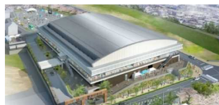
(都市構造再編集中支援事業) 【草津市】草津駅周辺都市機能誘導区域地区 (仮称) くさつアクアパーク整備事業

都市機能や居住環境の向上に資する公共施設等や 「居心地が良く歩きたくなる」まちづくりに対する支援を！