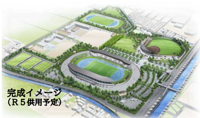
【広域防災拠点となる金亀公園】

2025年国スポ・障スポ大会に向け、会場となる公園や周辺の街路等の都市計画事業を計画的に進めるため、予算枠の拡大を！