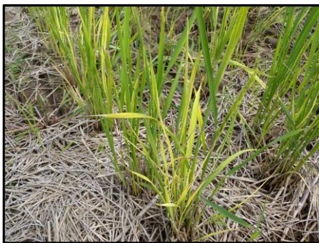
写真 イネ縞葉枯病が発病した 刈り株再生芽

本病の蔓延を防止するため、刈り株再生芽でイネ縞葉枯病の発生が目立つほ場では、速やかに刈り株をすき込みましょう。また、このような地域では、次作のヒメトビウンカの防除を検討願います。