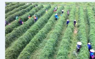
有機農園での花摘み

・タイの完全無農薬、無化学肥料栽培の有機農園の拡張等を目的とし、現地法人の設立を計画。 ・補助金を活用し、現地情勢や法制度等の調査を行い、 令和4年6月に現地法人を設立。今後は工場稼働を見込んでいる。