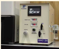
開発した洗浄装置

従来の手作業に比べ、 加熱加湿洗浄法® により 洗浄時間を1/20程度で同等の洗浄効果を有する洗浄装置 を開発した。平成29年に商品化し、これまで8件販売実績がある。滋賀県工業技術センターと共同研究を行い、特許を2件取得した。