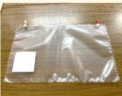
サンプリングバッグ