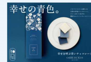
青いチョコレート