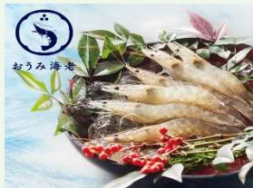
ブランド化に成功した「おうみ海老」