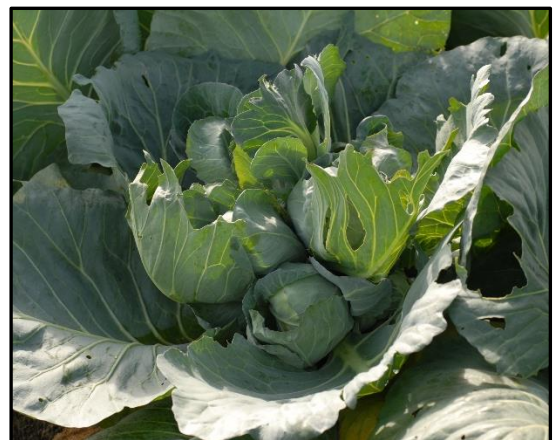
写真 食害を受け正常に結球しなくなった キャベツ

お問い合わせ先：滋賀県病害虫防除所 TEL:0748-46-4926 FAX:0748-46-5559 Email:gc70@pref.shiga.lg.jp http://www.pref.shiga.lg.jp/boujyo/