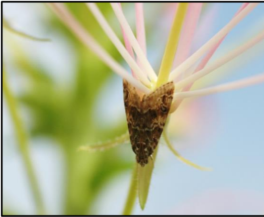
写真 クレオメ花上のハイマダラノメイガ成虫 (約 10mm)