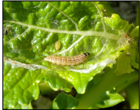
写真 ダイコン葉上の幼虫