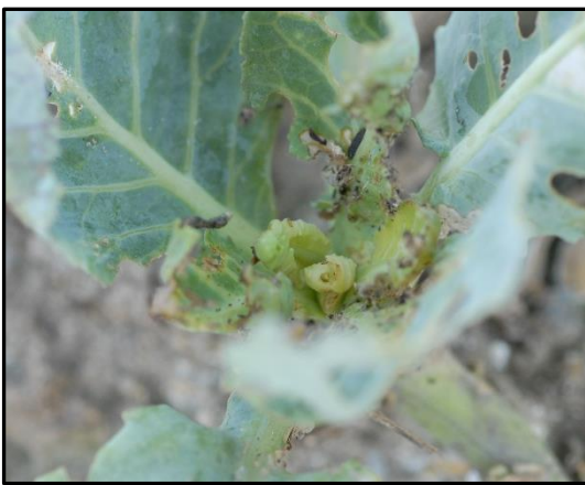
写真 食害を受け生長点が消失したキャベツ