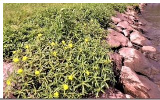
石組み護岸に生育したオオハナミスキンバイ

農地等での新たな生育の確認や石組み護岸やヨシ帯など機械駆除困難区域への対応が課題