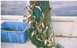
外来魚の集中駆除

外来魚の生息量は減少してきたものの、更なる対策の推進のため、多様な手法を組み合わせた防除を実施