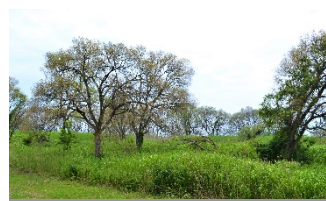
ヨシ群落内で巨木化したヤナギ

ヨシ群落の面積は概ね昭和30年代と同程度にまで回復したが、群落内のヤナギの巨木化等によるヨシの生育不良が見られる