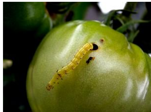
写真 トマトの果実に食入し加害する オオタバコガ幼虫

お問い合わせ先：滋賀県病害虫防除所 TEL:0748-46-4926 FAX:0748-46-5559 Email:gc70@pref.shiga.lg.jp http://www.pref.shiga.lg.jp/boujyo/