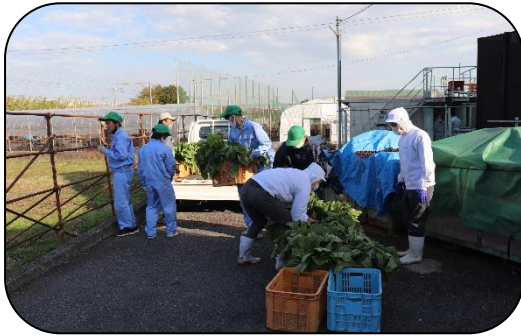
専門教科「農業」 (地元企業との連携授業)

1クラス8人のクラス集団を学習集団の単位として、基礎学力の充実を図り、社会的・職業的自立ができるように、一人ひとりの障害の状況や特性を把握し教育活動を展開する。