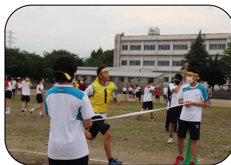
体育祭 （愛知高校との合同行事）

部活動についても、学習と共に重要視しており、全員参加を推進しています。本校と愛知高校の生徒が同じ部活動に参加し、両校の教員が互いの生徒を指導するなど、併設校としての利点を生かし、交流を図りながら活動しています。