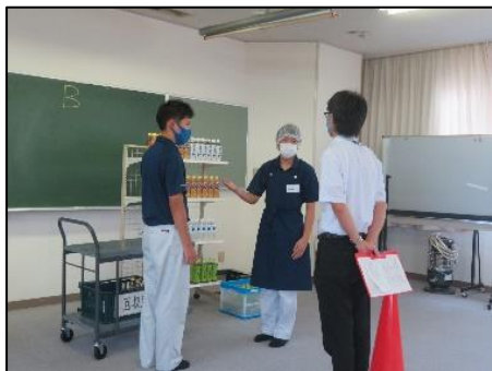
学校設定教科（スキルアップ）