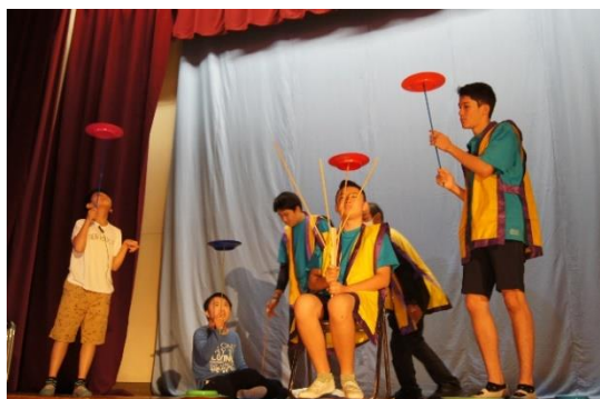
中学部 学習発表会

教育目標に基づいて、“力いっぱい生きる子ども”の育成を目指し、小学部・中学部・高等部の12年間を見通した系統的な教育課程づくり、安心・安全な学校づくりを進めています。また、保護者・関係機関・地域社会との密接な連携を図り、個別の教育支援計画・個別の指導計画を作成し、日々の学習を進めています。