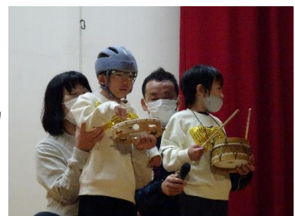
小学部 学習発表会