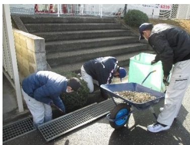
石部分教室 地域清掃

小・中学部では「交流及び共同学習」を積極的に進め、開校以来となる近隣の石部南小学校や石部中学校との「交流」を積み上げてきました。特に小学部では、石部南小の児童が来校し、各学級でお互いが楽しめる活動を工夫して取り組んでいます。