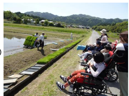
小学部地域の畑の見学

本校は、湖南市の西方に位置し、周りを自然豊かな山や林に囲まれた閑静なところにあります。昭和51年4月に、近隣の児童福祉施設内(県立近江学園、社会福祉法人椎の木会落穂寮)に設置されていた小学校・中学校の分校が独立し、知的障害のある施設入所の子どもたちが学ぶ学校として開校(県立石部養護学校)しました。その後、昭和54年4月の養護学校義務制実施により、校名を県立三雲養護学校と改め、現在の地に小学部・中学部の校舎を建設移転しました。同時に、地域からの通学生の受け入れと、独立行政法人国立病院機構紫香楽病院に入院中の児童生徒への訪問教育が始まりました。昭和57年には、高等部とともに紫香楽校舎が設置され、平成3年4月の全県的な学区再編成を経て、湖南市・甲賀市や近隣施設から知的障害の児童生徒に加え、肢体不自由の児童生徒も登校するようにな