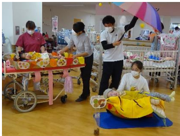
紫香楽校舎 学習発表会

りました。児童生徒数は開校当初の約3倍に増加したことから平成25年度に近隣の県立石部高等学校内に高等部単独の『石部分教室』が開設されました。この分教室は、「野洲」「草津」両養護学校および八日市養護学校の一部の通学区域に居住する生徒も対象としています。