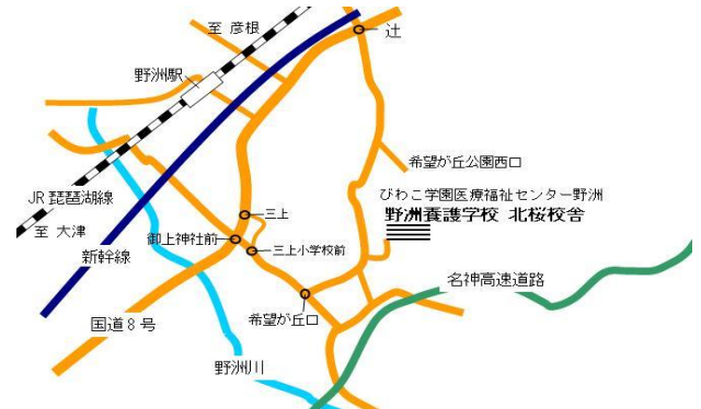
北桜校舎：JR 野洲駅から 6.5km