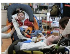
うんどうかいの様子

高等部では、3年間で社会的自立に向けた力を蓄え、豊かな卒業後の生活につなげていくため、青年期にふさわしい体力や働く意欲、豊かな人間性を育てることをめざし、さまざまな学習や体験的活動をおこなっています。