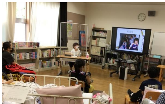
本校：先輩の話を聞く会 『社会人として活躍中の先輩を講師に迎えて』