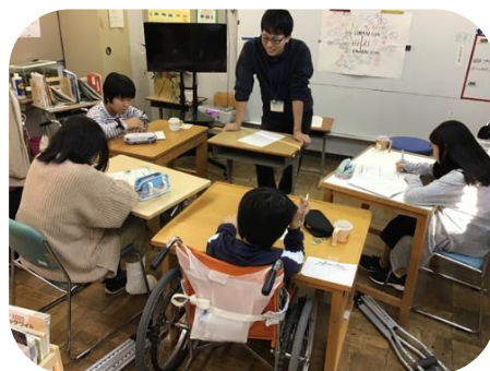
本校：中学部 自立活動 『ストレスについて』