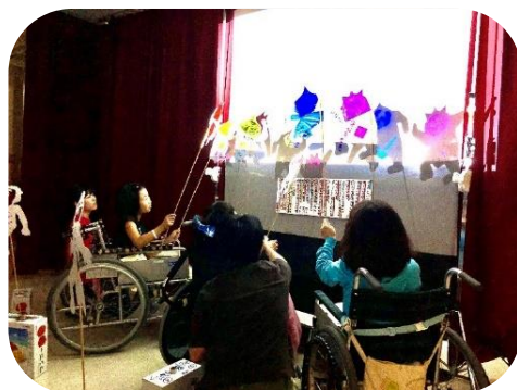
本校：小学部 文化祭 影絵劇『じごくのそうべえ』

対外的には、病弱特別支援学校のセンター的な役割として個別の教育相談のほか、病弱教育に関わる研修会の開催、小学校・中学校の病弱・身体虚弱特別支援学級や小児科病棟を有する病院等への訪問・相談活動などに取り組んでいます。