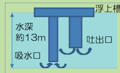
深層曝気装置の概要