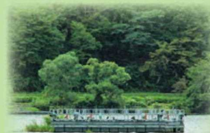
湖岸からの眺め (浮上槽)

このため、湖底に空気を多く含んだ水を送る装置を設置し、水質の悪化を防いでいます。