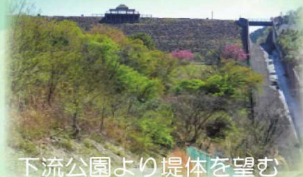
下流公園より堤体を望む