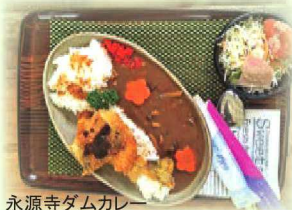
永源寺ダムカレー

滋賀県内のダムでは、宇曽川ダムのほかに青土ダム、野洲川ダム、永源寺ダムのダムカレーがあります。