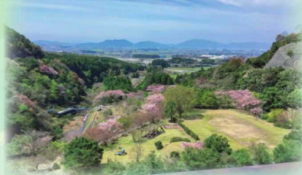
展望台からの眺め

治水ダムには常用洪水吐と非常用洪水吐がありますが、宇曽川ダムの堤体には、非常用洪水吐しか見当たりません。取水塔の内部に常用洪水吐が併設されているのです。