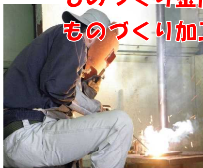
ものづくり加工科