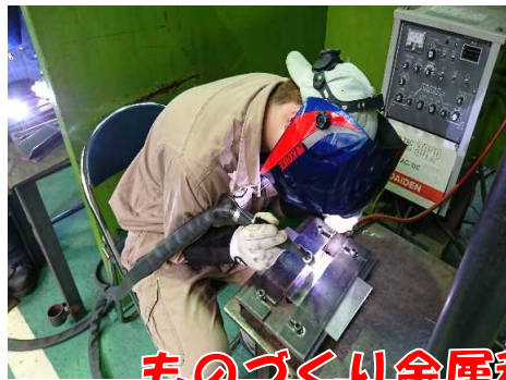
ものづくり金属科