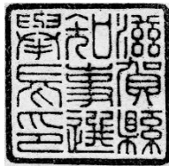
24ミリメートル平方