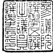
23ミリメートル平方