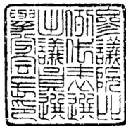
23ミリメートル平方