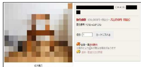
商品説明(正規品の約半値)