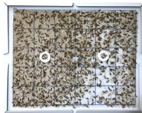
写真 フェロモントラップによるチャノホソガ成虫誘殺の状況(2022/6/3撮影)

お問い合わせ先：滋賀県農業技術振興センター茶業指導所 TEL：0748-62-0276 FAX：0748-62-7095 Email： GC60@pref.shiga.lg.jp URL： http://www.pref.shiga.lg.jp/nougicenter/about/gaiyou/103375.html