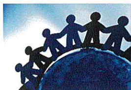
人材確保・労働室