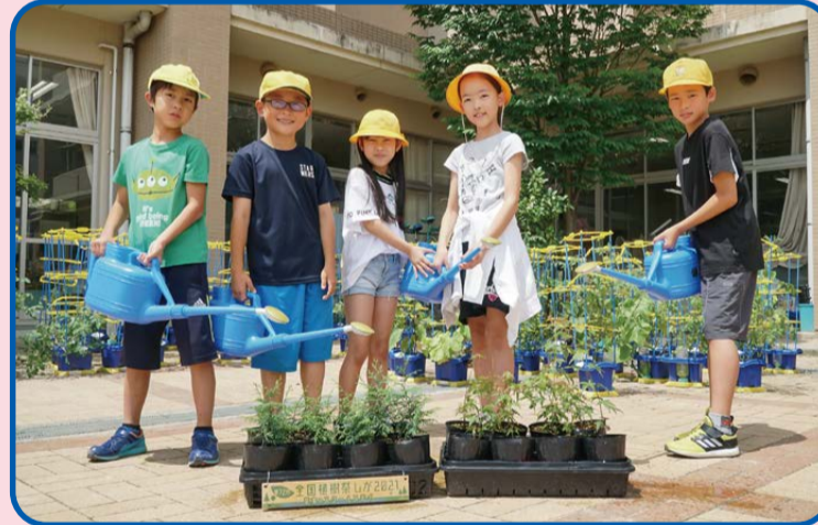
苗木を育てるみんな