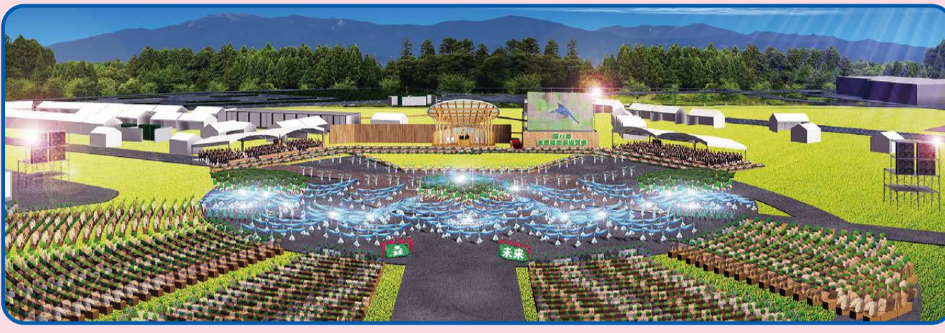
甲賀市「鹿深夢の森」のはなやかな式典会場(イメージ図)