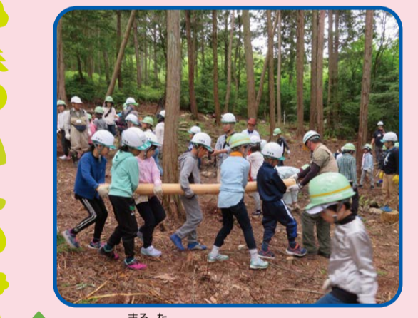
丸太をはこぶみんな