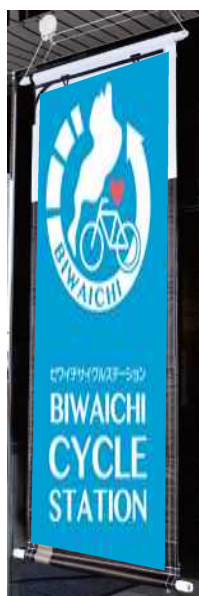
6・8 タペストリー(長方形)