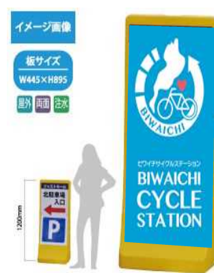
10 注水式スタンド看板(大)