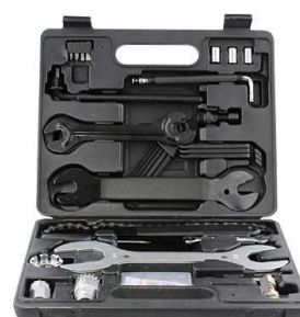
12 自転車用工具セット