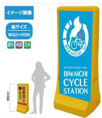
9 注水式スタンド看板(小)