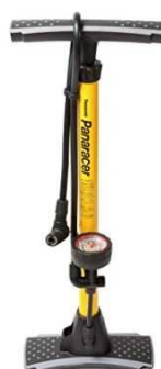
11 空気圧計付き三方式対応空気ポンプ