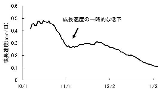
図2. 1月採捕にみられた成長速度の低下