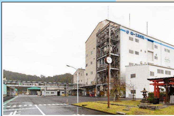
滋賀工場製造プラントとお稲荷さん