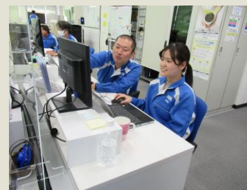
事務所での作業風景