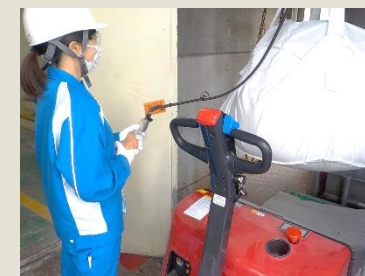
クレーンを用いた原料仕込み作業