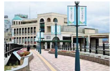
えきまちテラス長浜