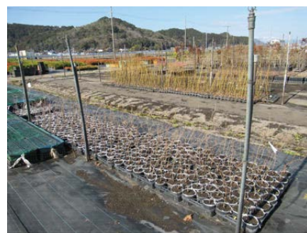
回収後の苗木(クヌギ・コナラ)

回収した苗木は、生分解性ポット(裏面「豆知識」参照)に植替えをし、引き続き植樹祭に向けて育成しています。