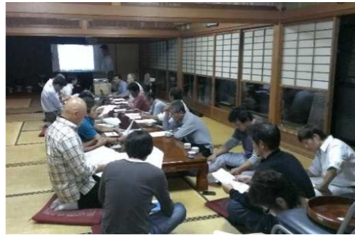
平成25年10月 避難について検討