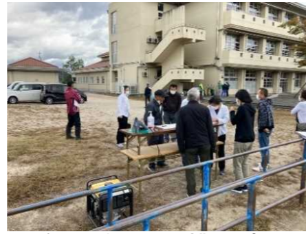
令和3年10月 避難訓練