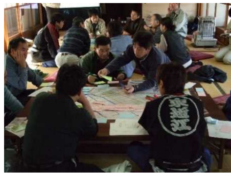
平成23年2月 図上訓練