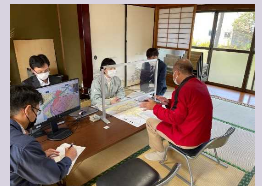
令和3年11月 個別説明窓口