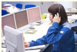
技術部門で活躍する女性社員