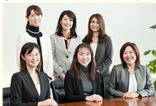
女性幹部とのコミュニケーション

「使命感」等を兼ね備え、自ら積極的に行動を起せる人材にご活躍いただきたいと思っています。情熱と志を持った皆さんとお会いできるのを楽しみにしています。