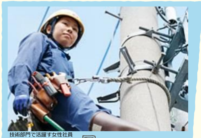
技術部門で活躍する女性社員