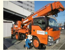
穴掘建柱車とリジナル飛び出し坊や

発電所でつくられた電気をお客さまのもとへお届けするため、電力システムの運用や送電、変電、配電の計画・工事などを行います。中立・公平な立場で安全に安定した電気を低廉な価格でお客さまにお届けし続けるとともに、安心してお使いいただける系統利用サービスを提供し続け、地域社会の発展に貢献していきます。