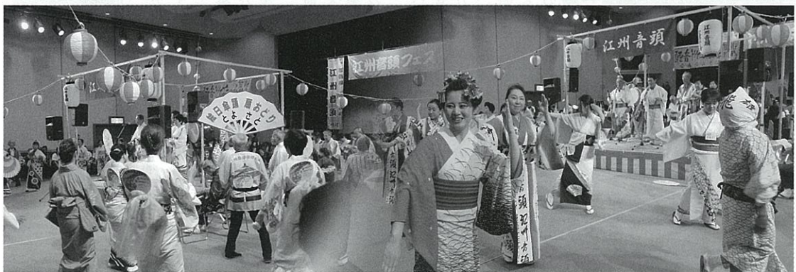
江州音頭フェスタ in しが 2018

滋賀県江州音頭普及会事務局 http://go-shu.biwako-visitors.jp/ 〒520-8577 大津市京町四丁目1-1 (滋賀県観光交流局内) TEL 077-528-3741 / FAX 077-521-5030