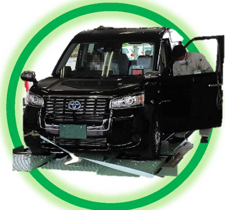
タクシーメーター