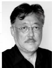
松本 修(台本・演出) Matsumoto Osamu

1955年、札幌市生まれ。文学座の俳優を経て、1989年に演劇集団MODEを設立。以降、演出に専念。チェホフ、ベケット、ワイルダー等の海外戯曲を独自のワークショップで再読、再構成して注目される。他に、柳 美里、松田正隆、平田オリザ、宮沢章夫等の同時代劇作家の書き下ろし作品の演出や、別役 実、唐 十郎、竹内統一郎等の現代日本戯曲の再読・新演出も多数。2000年代はカフカの小説を多数舞台化して高評を得る。現在、近畿大学文学部教授。読売演劇賞優秀演出家賞、同優秀作品賞、千田是也賞、紀伊國屋演劇賞個人賞などを受賞。著書に『ぼくの演劇ゼミナール チェホフの遊び方/カフカの作り方』(言視舎)がある。