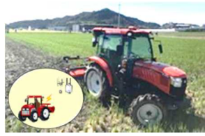
自動操舵付きトラクター