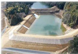
ため池の耐震化工事