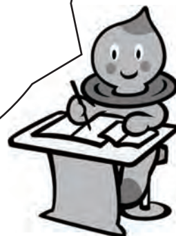
滋賀県の イメージキャラクター うおーたん