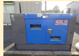
精製したBDF燃料により発電