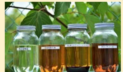
配食用油を精製し燃料に