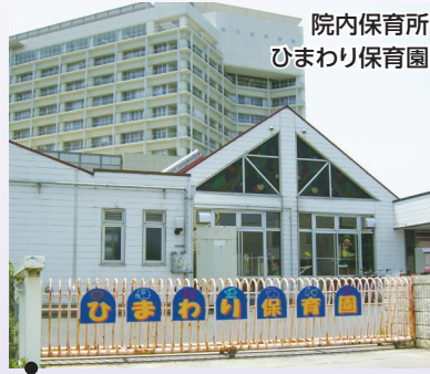
院内保育所 ひまわり保育園