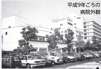
平成9年ごろの 病院外観