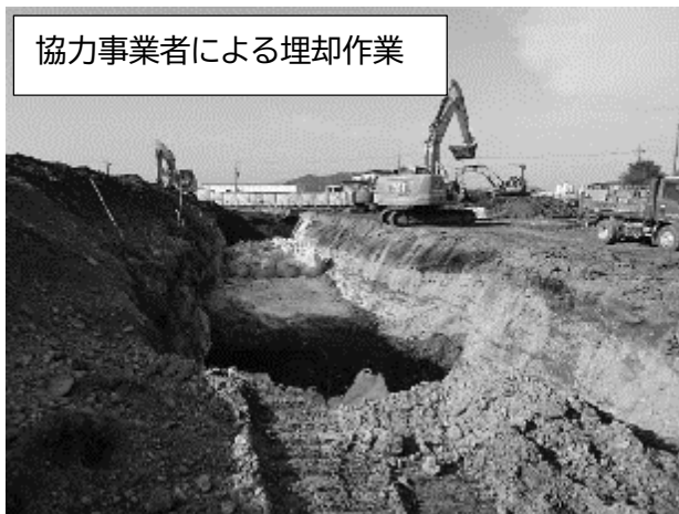
協力事業者による埋却作業