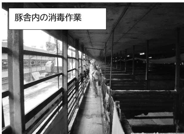
豚舎内の消毒作業