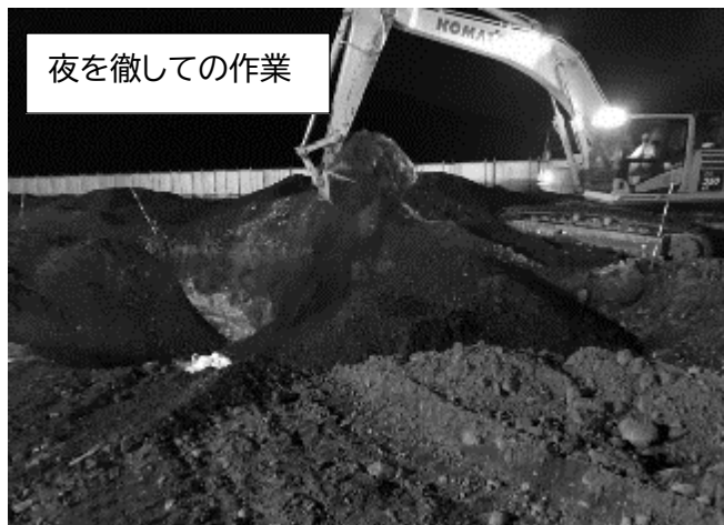
夜を徹しての作業