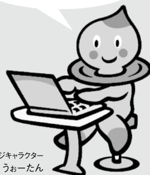
滋賀県イメージキャラクター うおーたん