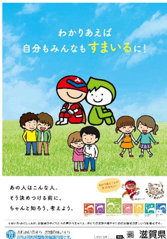
※1 令和3年度 同和問題啓発強調月間ポスター