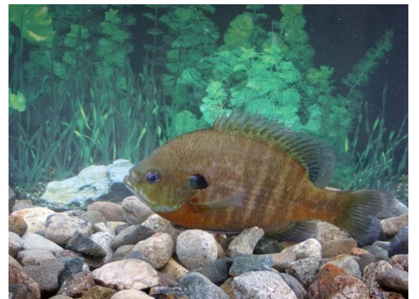
平成30年度に激減したブルーギル