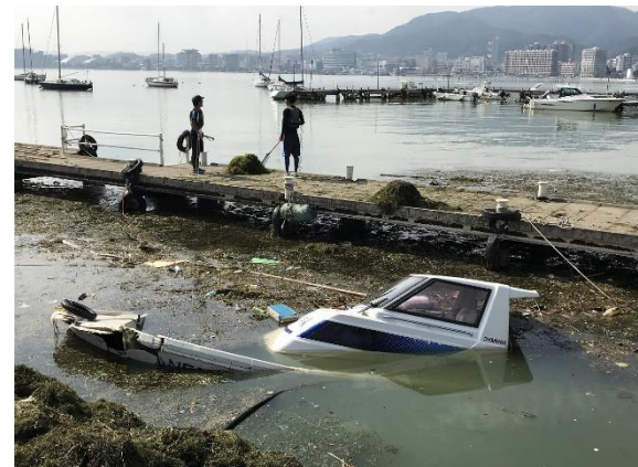
台風21号で座礁した船舶と多量の水草（9月）

平成31年4月には、琵琶湖の全層循環が観測史上初めて未完了になったということで大きなニュースになりました。全層循環のメカニズム等についての詳細は、本資料の「琵琶湖の底質」項目にあるトピックを参照してください。5月末時点では底層の溶存酸素濃度（DO）は7mg/L前後であり、多くの生物の生息環境に悪影響を与える2mg/Lを下回ってはいませんが、例年よりは低い濃度であり、今後の推移が懸念されます。