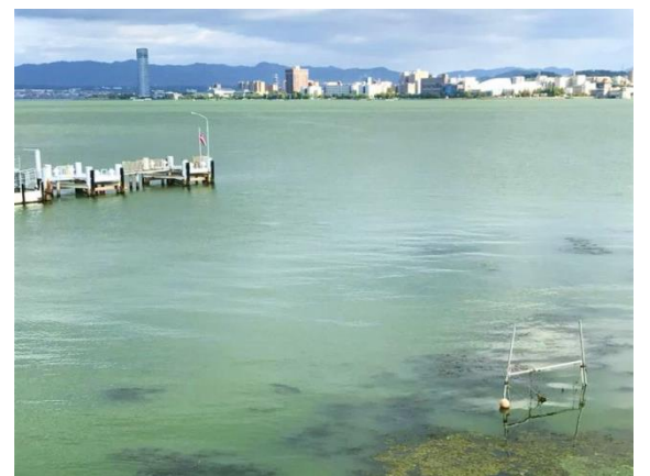
一面緑に染まった南湖（8月）