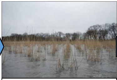
造成、ヨシ植栽を実施