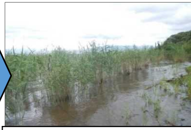
造成後、成長するヨシ帯