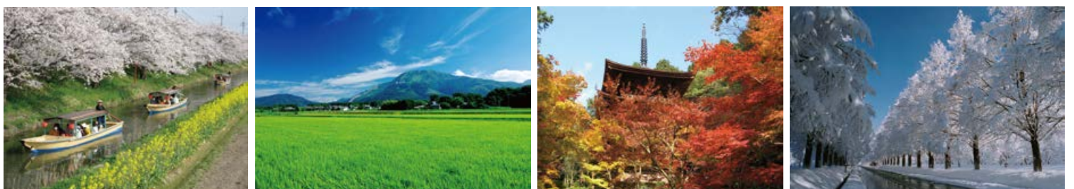
春夏秋冬さまざまな風景を楽しめます。(左から) 近江八幡水郷 (近江八幡市)、伊吹山 (米原市)、金剛輪寺 (愛荘町)、メタセコイア並木 (高島市)。