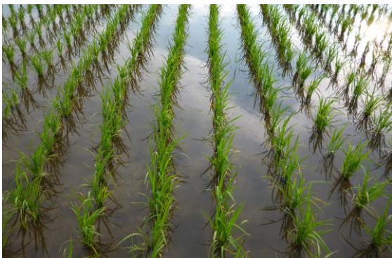
中干し開始時期の株張りの目安

○環境直接支払の長期中干しを実施される方は、 10aあたり1本以上 の溝切りを原則とし、 14日間以上の中干し を行いましょう。