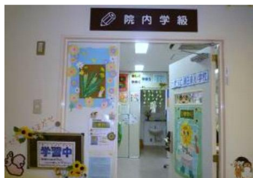
院内学級 教室の入り口

がちな病院での生活において生徒同士がふれあうことで、入院による不安(学習の遅れや疎外感など)を和らげるように取り組んでいます。自分の病室から登校し、学習したり同じ年代の他の生徒と話をしたり遊んだりすることを通して、病気克服への強い意志と希望や夢を育てます。単調な入院生活に変化を与えるとともに、また、退院後の学校生活にも自信をもつことにつながります。