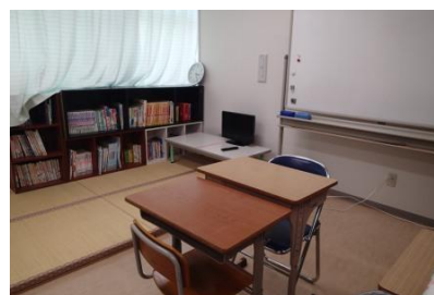
院内学級室内の様子

本学級は、昭和 63 年に高島小学校の病弱・身体虚弱学級として高島市民病院(旧 公立高島総合病院)に開設されました。入級対象は、当病院に入院を要し、主治医の学習許可が得られた小学生といたします。けがや病気の状態により、車椅子やストレッチャーでの通級や、ベッドサイド学習などを行うことがあります。